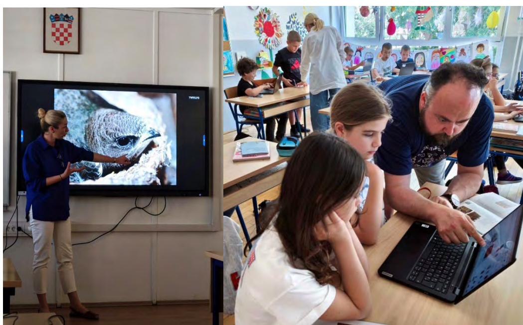
Slike 12. i 13. Radionice u sklopu projekta Čiope, naši susjedi

modeliranja. Projekt Čiope, naši susjedi provodi Udruga BIOM u partnerstvu s Prirodoslovnim muzejem Dubrovnik i Zajednicom tehničke kulture Grada Dubrovnika od siječnja do listopada 2025. godine, a sufinanciran je od strane Upravnog odjela za urbanizam, prostorno planiranje i zaštitu okoliša Grada Dubrovnika kroz Javni poziv za su/financiranje projekata u području zaštite okoliša i prirode te urbanizma i prostornog planiranja od interesa za Grad Dubrovnik. Kroz niz edukativnih aktivnosti, projekt ima za cilj podići svijest javnosti – posebno školske djece i nastavnika – o problemu nestajanja čioipa iz urbanih sredina te potaknuti razvoj konkretnih mjera za očuvanje ovih korisnih ptica.