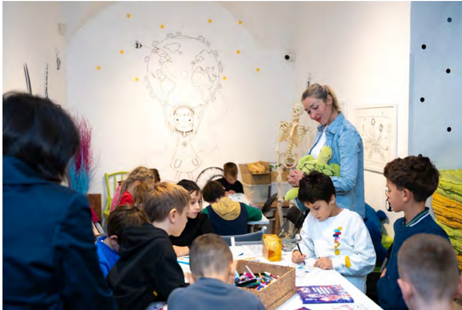
Slika 23. Radionica Morski svijet