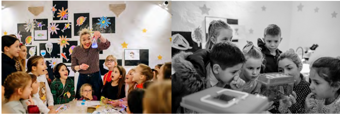
Slike 1. i 2. Radionice Što se skriva u kapljici vode? i Savršeno nevidljivi – paličnjaci