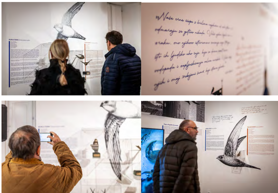
Slike 34., 35., 36. i 37. Detalji izložbe Čiope – ukrasi dubrovačkog ljetnog neba

Prvobitni planirani trošak programa: 25.000,00 EUR. Planirani trošak programa nakon II. izmjena i dopuna financijskog plana: 28.545,00 EUR.