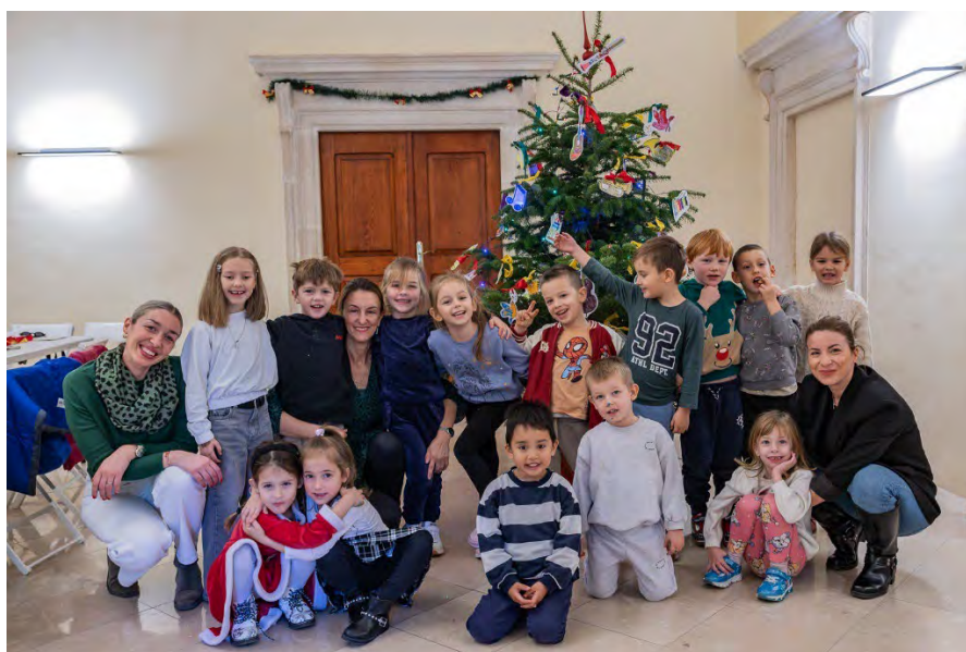
Slika 27. Božićna radionica