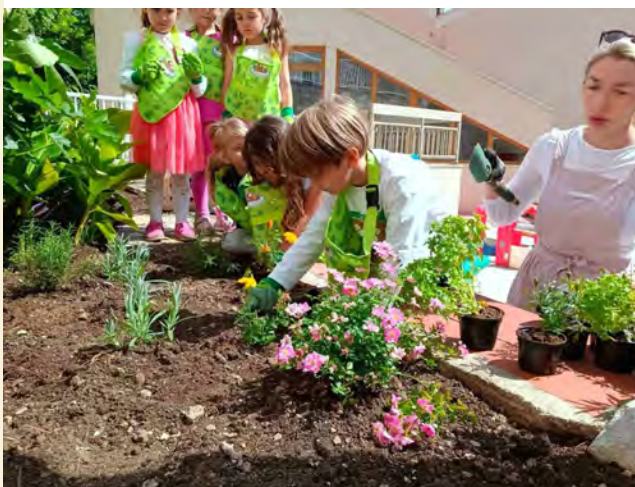
Slike 15. i 16. HortiKultura od malih nogu