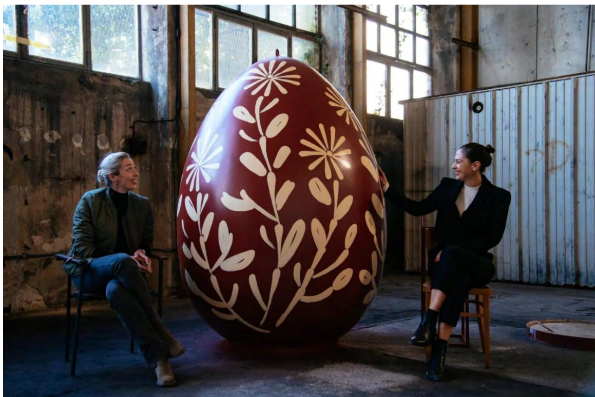
Slike 41., 42. i 43. Replike originalnih penganih jaja u velikim dimenzijama