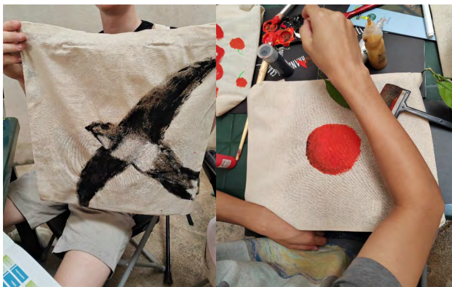
Slike 19. i 20. Oslikavanje platnenih torbi