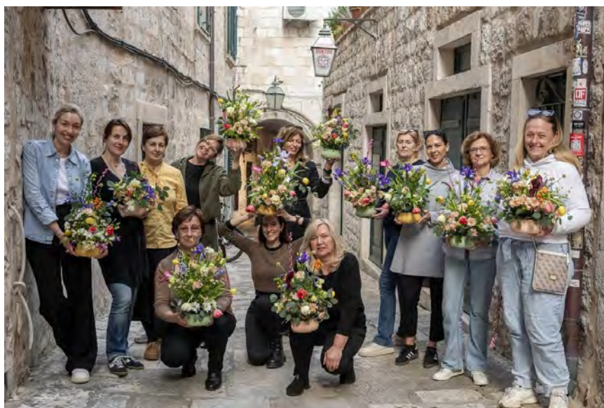
Slika 5. Radionica Cvjetni kolaž