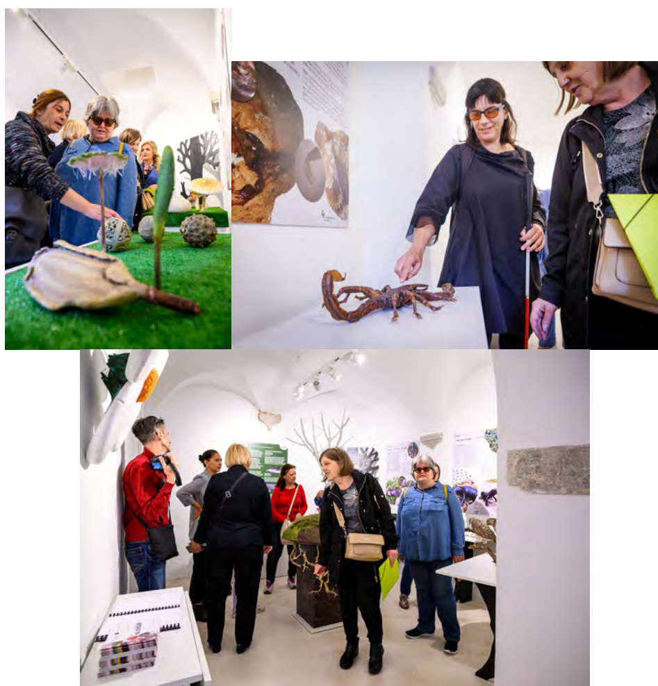
Slike 38., 39. i 40. Izložba Priroda na dodir

Izložba se sastoji od trodimenzionalnih modela koji predstavljaju uvećane kopije originala – od spora mahovina, preko gljiva, kukaca, vodozemaca i riba do ptica i dupina. Slabovidne osobe putem dodira mogu osjetiti strukturu i građu primjeraka flore i faune tj., mogu „vizualizirati“ njihov izgled. Pomoću QR koda otvara se audio vodič, odnosno čuju se glasovni opisi predmeta. Većina predstavnika živog svijeta na izložbi je uvećana u usporedbi s njihovom prirodnom veličinom. Tako su škorpion i bogomoljka dugi 50 cm, a daždevnjaci i više. Na sporama mahovine, koje se u prirodi ne mogu vidjeti golim okom, primijetiti ćete pravilne površinske strukture. Tu je i jedan predstavnik svijeta riba, dva predstavnika gmazova, a nesit i kobac su predstavnici ptica. Najbrojnije su gljive, gdje smo kroz nekoliko vjernih kopija prikazali svu raznolikost oblika tih organizama koji nisu ni biljke ni životinje.