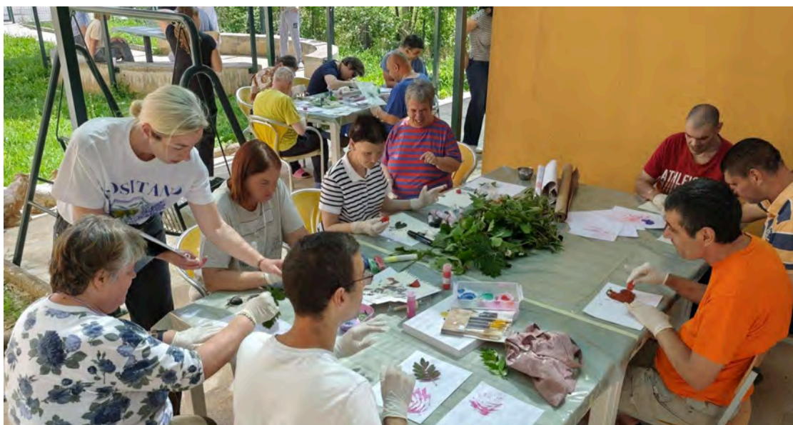
Slika 14. Baština dostupna svima