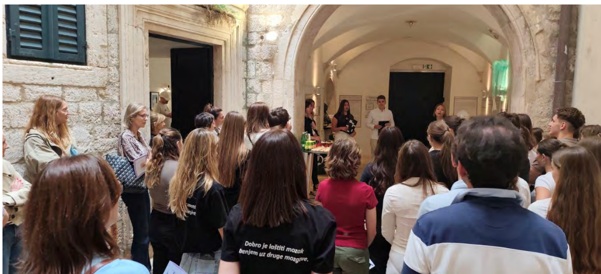
Slika 28. Radionica Istraži-dokaži-objavi / Turizam bez cenzure