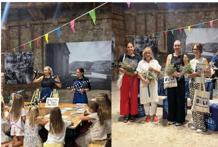
Slike 17. i 18. Festival soli