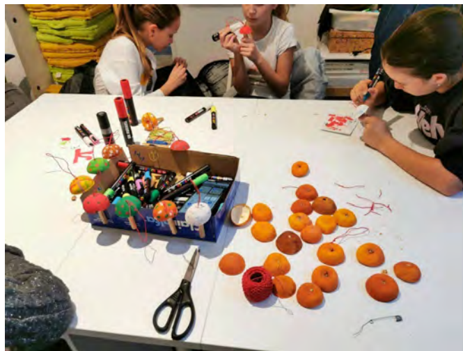
Slika 24. Božićna radionica