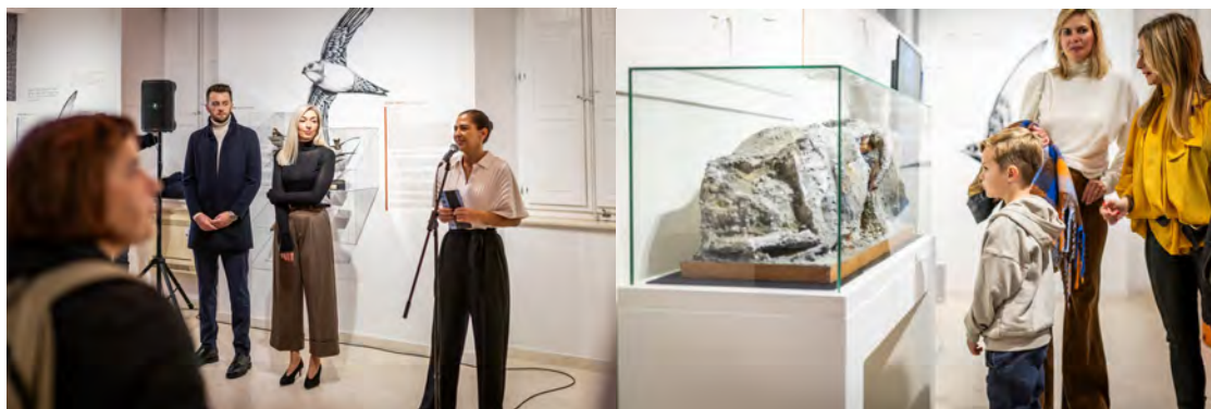
Slike 32. i 33. Otvorenje izložbe Čiope – ukrasi dubrovačkog ljetnog neba

Izložba prikazuje biološke osobitosti čiope s posebnim naglaskom na tri vrste koje obitavaju na području Republike Hrvatske (bijela Tachymarptis melba , crna Apus apus i smeđa Apus pallidus ). Rasprostranjene su po čitavoj Hrvatskoj, ali s obzirom da im odgovara topla klima, u najvećem ih broju pronalazimo u primorju. Crnu i smeđu čiope uobičajeno susrećemo na području mnogih priobalnih i kontinentalnih gradova, dok je Dubrovnik jedini hrvatski grad u kojem se gnijezde bijele čiope. Ptice su selice te u Hrvatsku dolaze krajem kalendarske zime i početkom proljeća kako bi podigle novu generaciju ptica. Zbog sličnog načina života ljudi čiope često smatraju lastavicama, no zapravo su u najbližem srodstvu s kolibrićima.