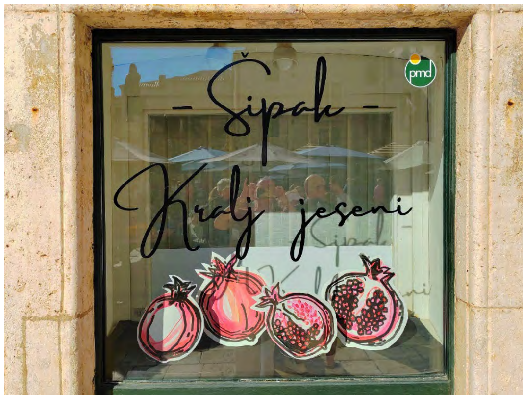
Slike 44. i 45. Izlog pisarnice Grada Dubrovnika