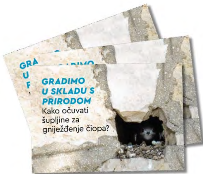
Slika 31. Publikacija Gradimo u skladu s prirodom: Kako očuvati šupljine za gniježđenje čiope?