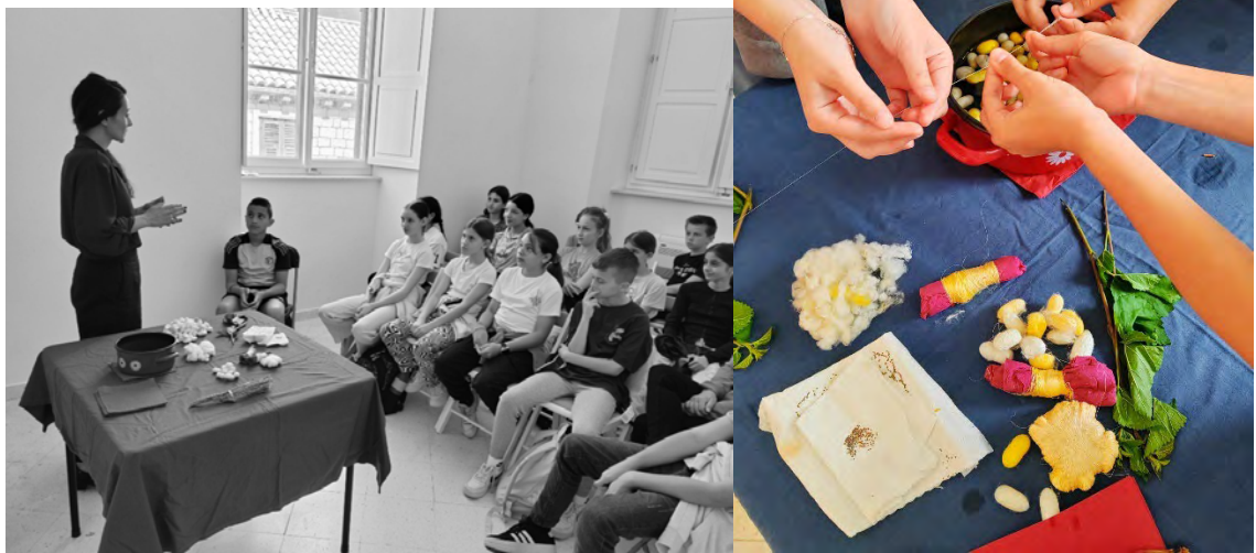
Slike 8. i 9. Radionica Pletem kao bubica