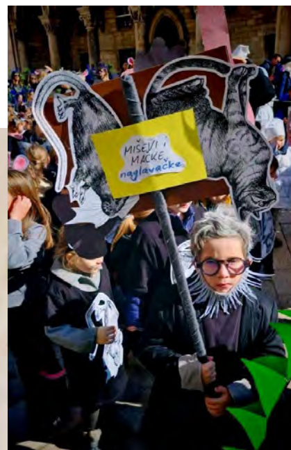
Slike 3. i 4. Maske Dubrovački gospar i Miševi i mačke naglavačke