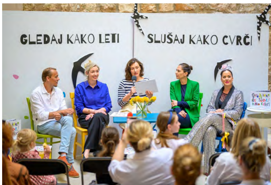
Slike 29. i 30. Promocija edukativne muzejske publikacije Gledaj kako leti, slušaj kako cvrči